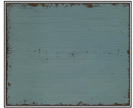
BLEU HORIZON ANCIEN